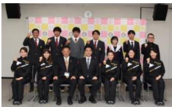
第77回国民体育大会「いちご一会とちぎ国体」 入賞選手報告会(11月16日(水))於:みよし市役所

激励会の開催や激励金の交付により、選手のモチベーションを高めることで競技力向上に繋げることができました。また、懸垂幕やPR看板等を作成し、本市にゆかりのある選手の活躍を発信することにより、市全体で選手を応援する機運を高めることができました。