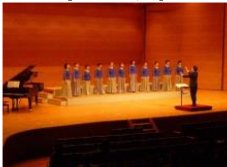
市民合唱交流会 【11月27日(日)】