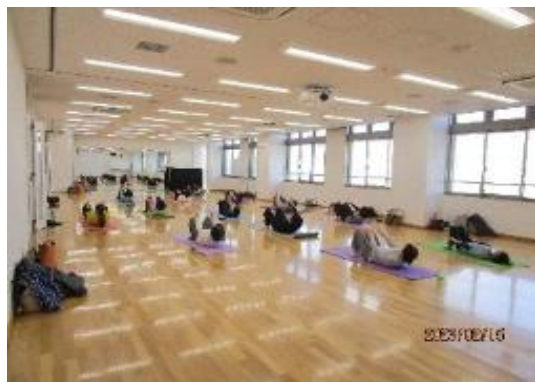
ヒップホップダンス 講座風景

多様な生涯学習講座の開催を通じて、市民の教養及び生活文化の向上を図ることができました。