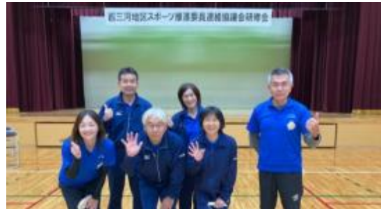
西三河地区スポーツ推進委員実技研修会 (10月29日(土))