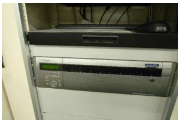
防犯カメラハードディスク

サンライブを有効に活用することによって、生涯学習活動に取り組む市民の知識の習得及び学習意欲の向上を支援することができました。また、適切な修繕等を行うことによって、市民が安全に安心して利用できる施設を維持することができました。