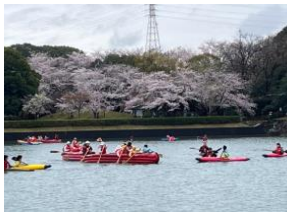
日本カヌーポロ選手権大会(9月15日(土)、16日(日)) 水上deお花見(3月25日(土)、26日(日))