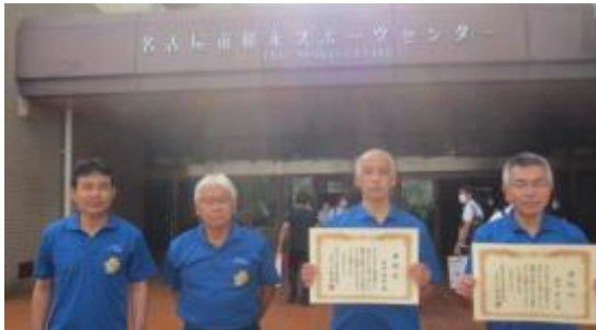
愛知県スポーツ推進委員研修会(9月3日(土))

新型コロナウイルス感染症の影響により、中止していた各種スポーツイベントを全て実施することができました。また、研修会で得た知識・技能を活用し、本市のスポーツを推進することができました。