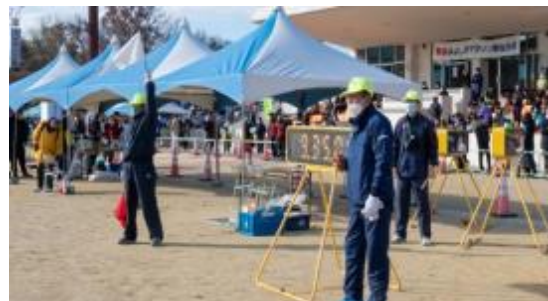
令和5年新春みよし市マラソン 駅伝大会(1月29日(日))