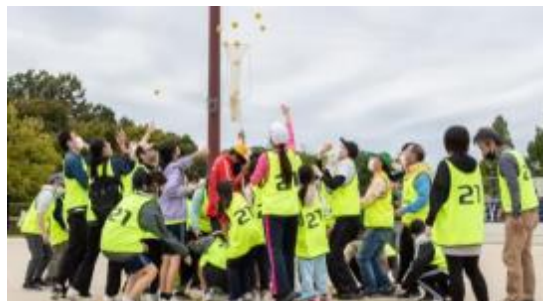
みよしスポーツ祭2022(10月9日(日))