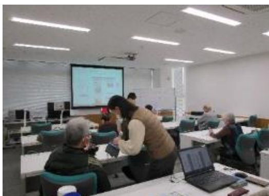
簡単スマホの使い方 講座風景