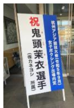
杭州アジア競技大会(令和5年9月) 女子ボクシング出場内定選手PR看板