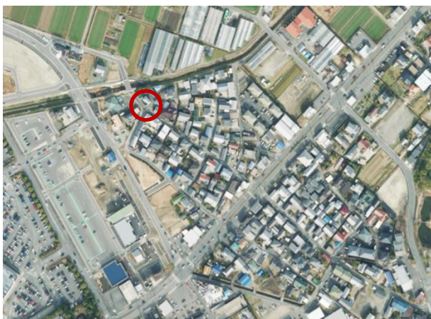
防火水槽位置図(三好町地内)

当該防火水槽撤去工事に付随して防火水槽撤去に伴う地盤変動影響事前調査を実施しましたが、工事完了後にも事後調査を実施する必要があるため、本業務委託についても繰越明許とします。