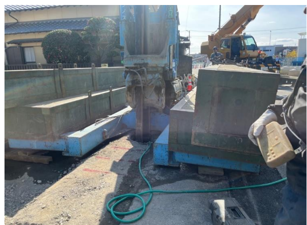
矢板打ち込み作業(参考)